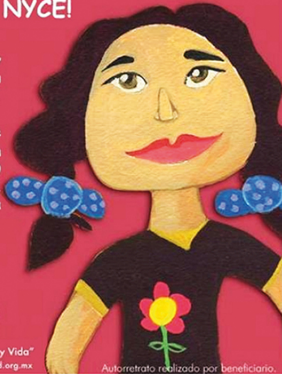
Autorretrato realizado por beneficiario.

"Amor, Esperanza y Vida" www.casadelamistad.org.mx